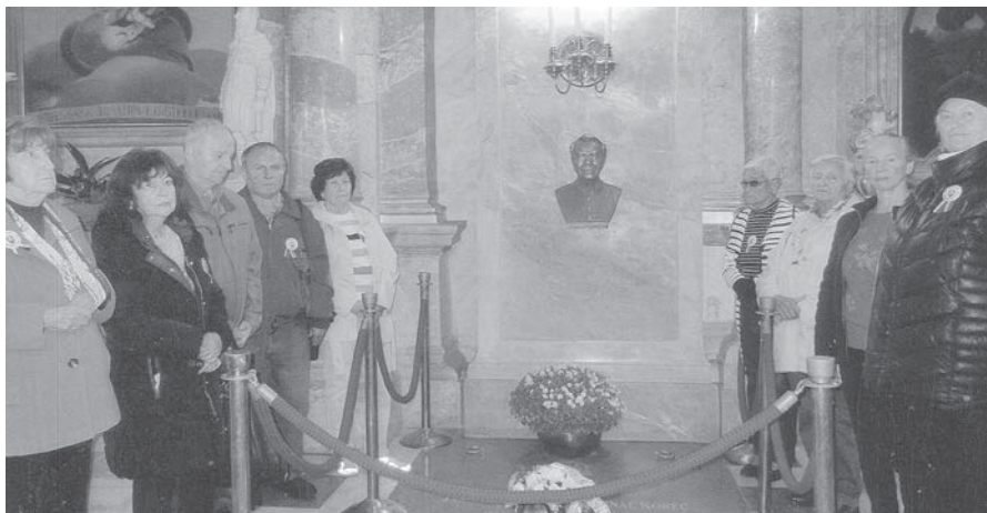
V Bazilike sv. Emeráma spomínajú na kardinála Korca členovia RO PV ZPKO v Nitre.

Na výročie úmrtia kardinála Korca, 24. októbra tohto roku, sa členovia regionálnej organizácie PV ZPKO v Nitre