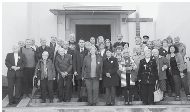
Spomienková snímka z Ilavy.

„Našou úlohou je dnes pokračovať a šíriť posolstvo stojace na tisíckach zmarených životov. Približovať a ozrejmovávať históriu a jej súvislosti mladým generáciám a nikdy, nikdy na to nezabudnúť. Aj tento mrazivý odkaz je dnes živý“, povedal vo svojom príhovore dubnický primátor. Primátor Ilavy pokračoval: „Musíme sa takto stretávať a snažiť sa tieto príbehy a životné skúsenosti ľudí, ktorí za týmito múrmi trpeli pre svoje presvedčenie a pre svoj názor pripomínať aj ďalšej generácii. I dnes vidíme, koľko autoritatívnych a totalitných režimov opäť sa snaží rôznym spôsobom prekrúcať a deformovať pravdu. Proti tomu sa treba postaviť“, zdôraznil.