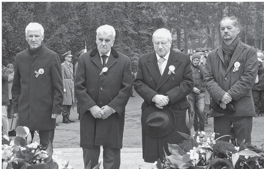
Predsedníctvo PV ZPKO pred pamätníkom obetí komunizmu.