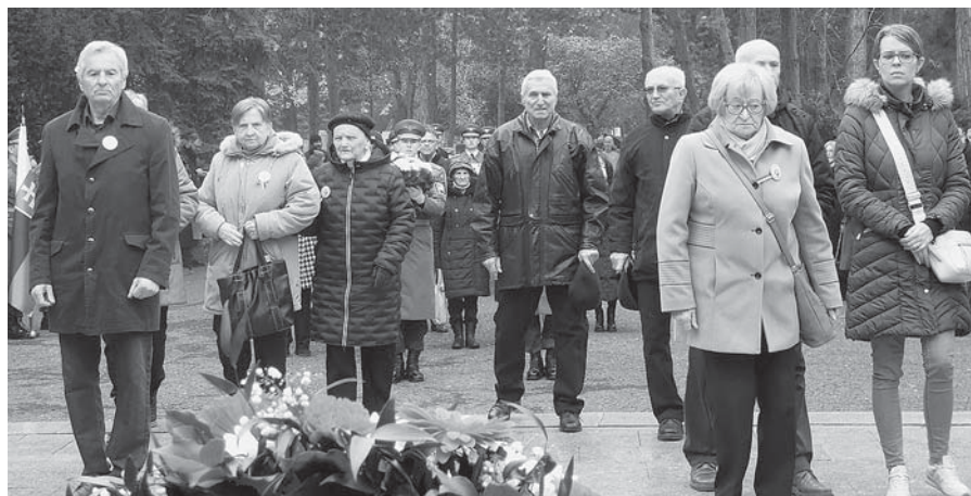
Členovia PV ZPKO počas slávnostného aktu kladenia vencov.

nené, môžu i dnes prispievať k oživeniu démonov nevráživosti. Nesmie sme však dopustiť, aby táto negatívna