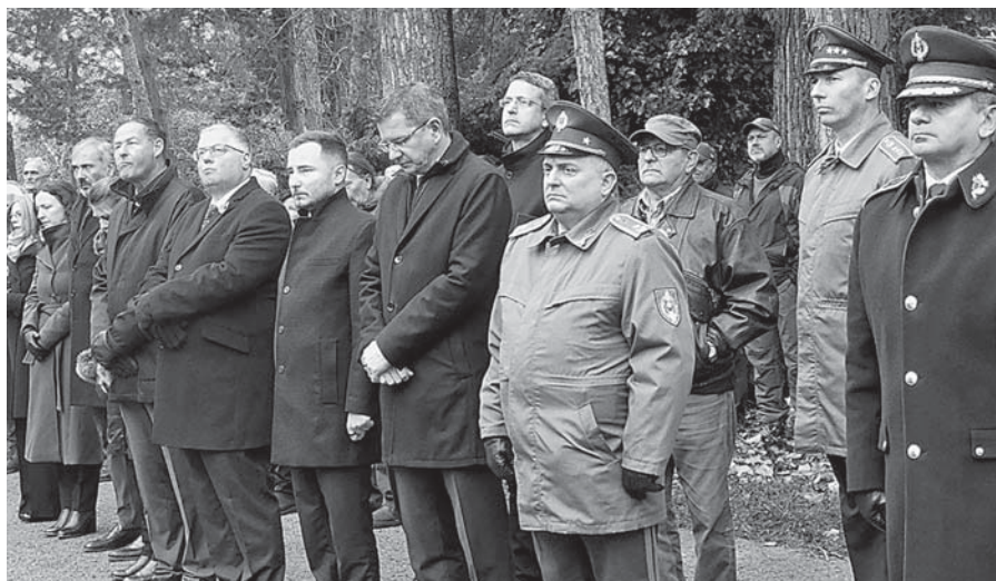
Hostia na Cintoríne Vračuňa.