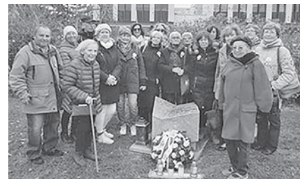
Pri pamätníku v Nitre.

Mestský úrad v Nitre organizoval spomienkové stretnutie k 35. výročiu Novembra '89 pri Berlínskom múre na Štefánikovej triede. Pozvanie prijala aj