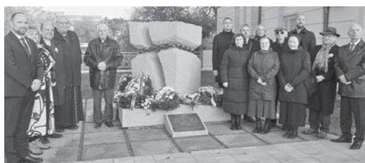
Pri pamätníku v Trnave.