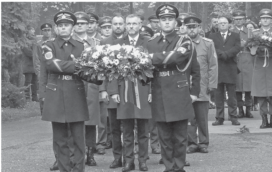
Prezident SR Peter Pellegrini počas aktu kladenia venčov.