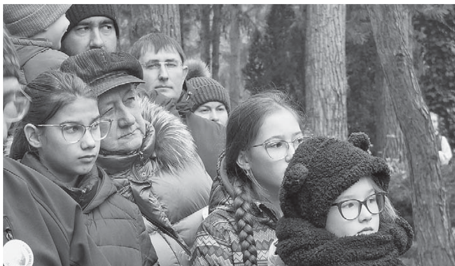
Záujem mladých je nádej.