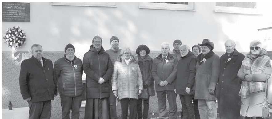
Účastníci pietnej spomienky v Bijacovciach.